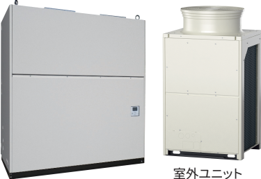
室内ユニット 室外ユニット