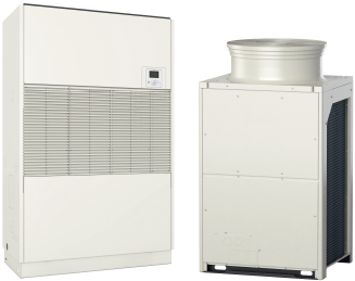
* 写真はベルトレス方式です。 室内ユニット 室外ユニット

一般空調用からオールフレッシュ型、クリーンルーム用までカバーする充実のラインアップ 一般空調用とオールフレッシュ型は 1600 型(60 相当馬力)まで品揃え