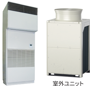
室内ユニット 室外ユニット