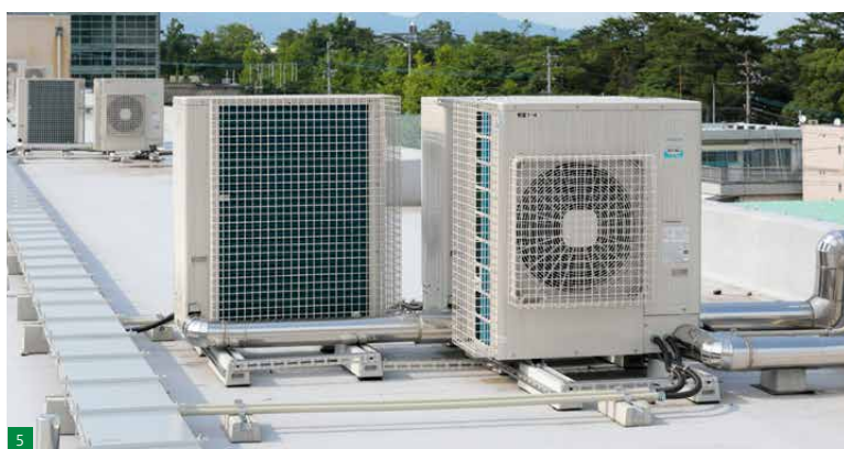
1 各教室の室内ユニットには「てんつり」を設置。2 各教室の空調は職員室の「適温適所mini」で集中管理。3 教室ごとに多機能リモコンを設置。オンオフと風量・風向の調節以外の操作は「適温適所mini」で制限。4 スペースの広い特別教室（写真は技工室）には「てんつり」を2台設置。5 室外ユニットには省エネ性を重視して「省エネの達人（R32）」を採用。防護ネットで安全性を確保。