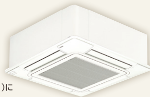
てんかせ4方向(RCI-GP160K3)に側面カバーを取り付けた状態

スケルトン天井で室内ユニットを設置する場合、側面カバーを使用することで、見た目もスッキリと設置できます。