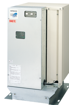
※ 本機は屋内設置タイプです。

出荷時にはライン入口温度制御仕様です。工場の生産プロセス冷却で、ライン出口温度制御が必要な場合でも本体側切替操作により変更可能です。